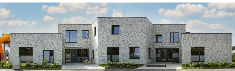
Movere-Gebäude an der Eschenallee 16, 59063 Hamm

IBAN: DE 89 4105 0095 0010 000 529 BIC: WELADED1HAM